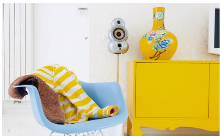
1 Anki举办“个人展”的角落 2-3 喜欢鲜艳色彩的Anki强调白色背景有助整体环境更耐看