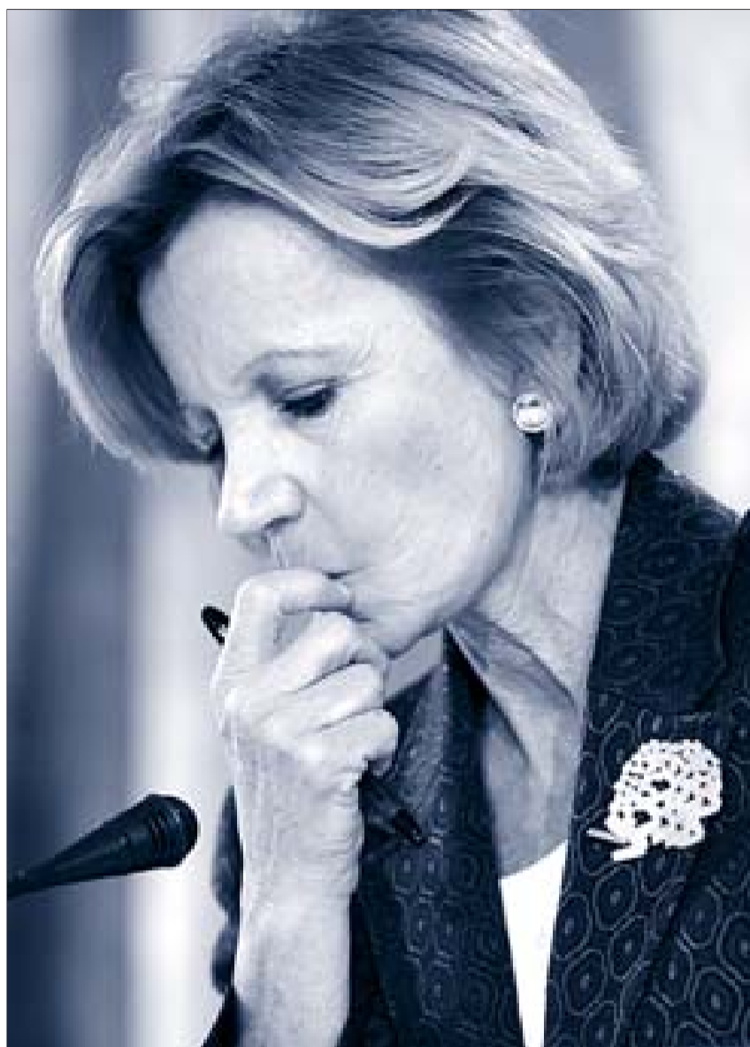
La vicepresidenta económica, Elena Salgado, ayer, durante su comparecencia.

Que a la medida todavía le falta un hervor importante lo demuestra el hecho de que Salgado argumentó que existen asociaciones de prejubilados y jubilados que prestan estos servicios y puso como ejemplo a Secot (Seniors Españoles para la Cooperación Técnica). Pero, según fuentes de Secot, sus componentes no cobran por sus asesorías, sino que es la asociación quien recibe la ayuda o subvención por esos servicios prestados y «no los percibe directamente el senior».