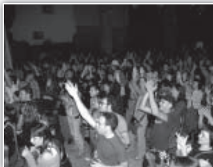
Ambientazo con Acquaragia Drom.

trepidante, lleno de ritmo, humor y, sobre todo, calidad. Su increíble mezcla de Klezmer y aires gitanos nos transportó a todos a una fiesta colectiva de la que era absolutamente imposible escapar.