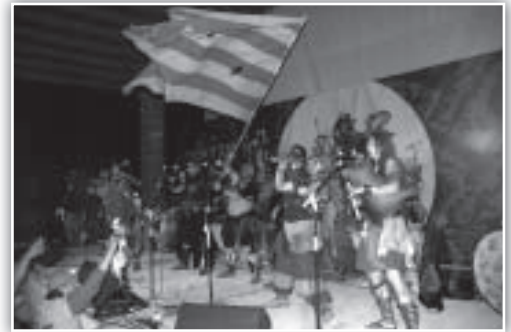
Lurte sobre el escenario de Poborina Folk.