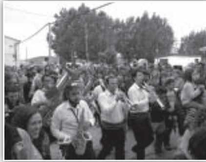
Numeroso público siguió a Tandarika por las calles.