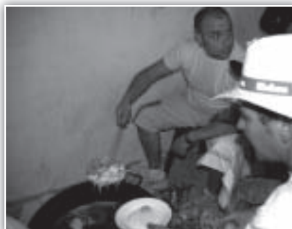
Y antes de seguir, a reponer fuerzas...

A las once de la noche, los TAMBORES DE TERUEL (Aragón) comenzaban su estruendosa actuación en la plaza del ayuntamiento para permitir que terminaran con tranquilidad sus pruebas de sonido los grupos de la noche. En esta ocasión, presentaban una formación mixta de niños y adultos, impresionante grupo que sobrepasaba el medio centenar de tambores y bombos. Ejecutaron parte de su repertorio