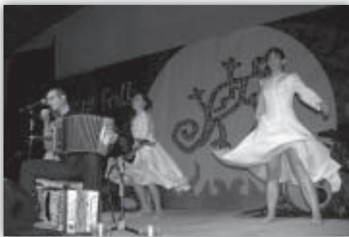
Magnífica propuesta de Korrontzi sobre el escenario.

Terminadas las Albas, comenzó el HORNO DE RAKÚ de FERNANDO TORRENT (Aragón) que, por precaución ante la amenaza de lluvia, se desarrolló junto al escenario principal al que unos minutos después de las doce subían los vascos de KORRONTZI (Euskadi) quienes, siguiendo la estela de otros grandes grupos vascos que han pisado nuestro escenario, realizaron uno de los conciertos más gratamente sorprendentes de cuantos hemos vivido en Poborina Folk. La magnífica combinación de música y danza consiguió captar la atención y ganarse la simpatía de un público que terminó entregado a esta buenísima formación de Getxo.