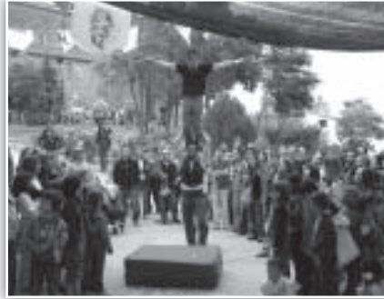
Tandarika en la plaza del ayuntamiento.