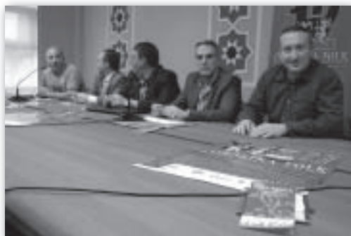
Rueda de prensa de presentación de la XII Edición de Poborina Folk. Sede de la Comarca "Comunidad de Teruel"