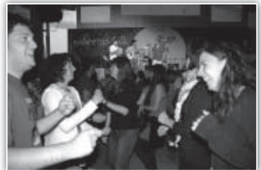
Bailando ritmos castellanos con Hexacorde.