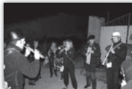
Alarifes en un momento del Encuentro de Gaiteros.