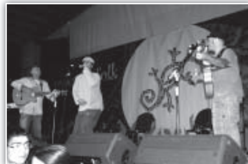
AiAiAi, lo mejor de la rumba catalana para cerrar.

Para finalizar, otra estupenda propuesta. La doceava edición la cerraba el trío AI AI AI! (Cataluña), que con su particular visión de la rumba catalana nos mantuvo bailando hasta pasadas las cinco de la madrugada. Magníficos músicos –formaron parte de la banda