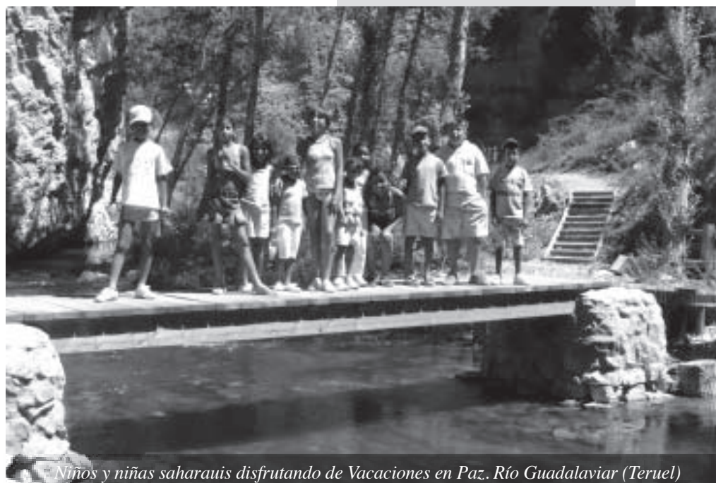
Niños y niñas saharauís disfrutando de Vacaciones en Paz. Río Guadalaviar (Teruel)

Asociación Lestifta Amigos del Pueblo Saharaui en Teruel