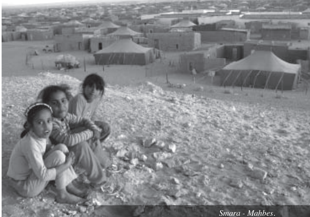
Smara - Mahbes.

¿Podría un árbol crecer sin raíces?. Todos diríamos que no, que es imposible, sin raíces un árbol no podría obtener alimento ni permanecer anclado a la tierra. De la misma manera ocurre con la cultura y los pueblos. Los pueblos serían el árbol y sus culturas las raíces que alimentan estos pueblos y los dotan de una identidad que resulta fundamental para el crecimiento y desarrollo de cada uno de los individuos y de dichos pueblos.