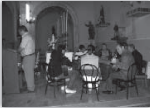
Las Albas. La Rondalla de El Pobo tocando en la iglesia.

Terminadas las Albas, comenzó el HORNO DE RAKÚ de FERNANDO TORRENT (Aragón) que, por precaución ante la amenaza de lluvia, se desarrolló junto al escenario principal al que unos minutos después de las doce subían los vascos de KORRONTZI (Euskadi) quienes, siguiendo la estela de otros grandes grupos vascos que han pisado nuestro escenario, realizaron uno de los conciertos más gratamente sorprendentes de cuantos hemos vivido en Poborina Folk. La magnífica combinación de música y danza consiguió captar la atención y ganarse la simpatía de un público que terminó entregado a esta buenísima formación de Getxo.