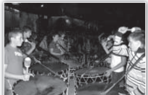
Actuación de Tambores de Teruel en la plaza.