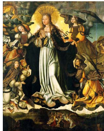
Asunción Maestro de Sardeal (¿Vicente Gil?) Museu Nacional de Machado de Castro