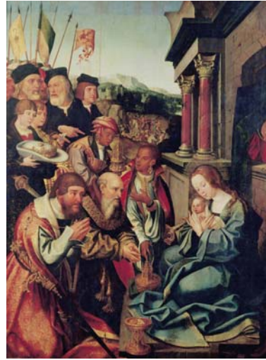
Adoración de los Magos Gregório Lopes y Jorge Leal Museu Nacional de Arte Antiga