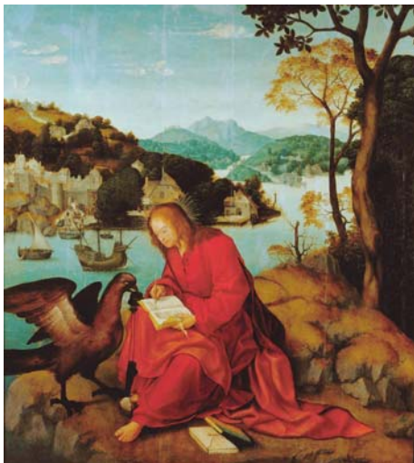
San Juan Evangelista en Patmos Maestro de Lourinha Santa Casa da Misericórdia da Lourinhã