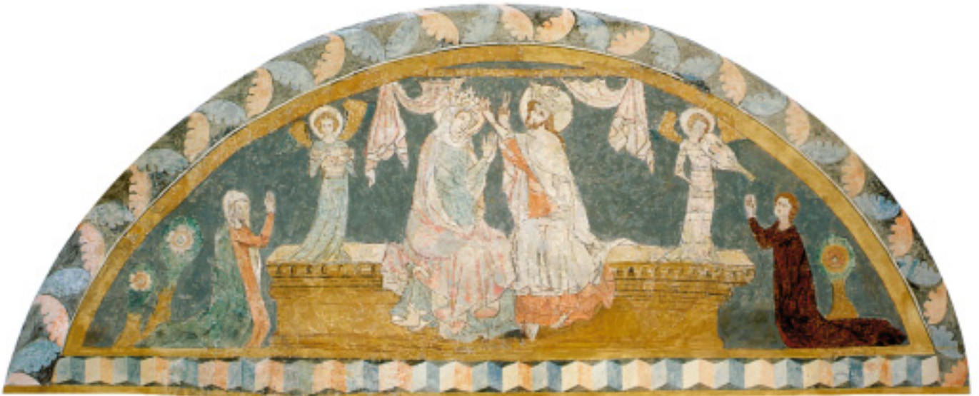
Marienkronung, Wandbild in der Clemenskirche Horrheim, Stadt Vaihingen an der Enz, um 1320.