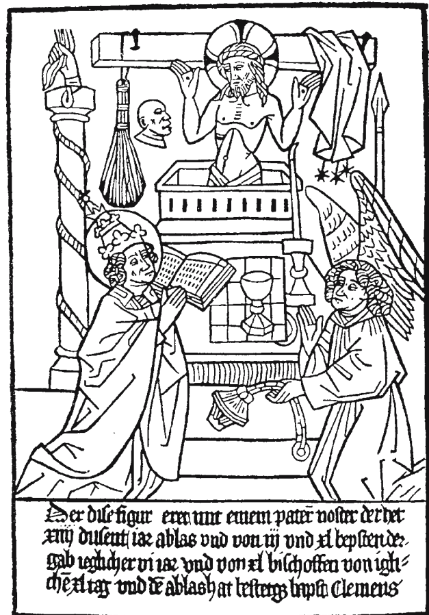
Ablassbrief, Einblattdruck, 15. Jahrhundert.

Vorlage: Illustrierte Geschichte der deutschen frühbürgerlichen Revolution, Berlin 1974, Seite 49