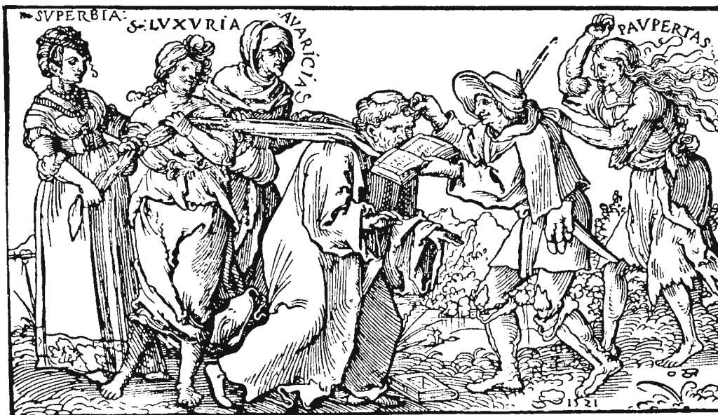
Spottbild auf das von weltlichen Gelüsten erfüllte Leben der Geistlichen, Holzschnitt von Hans Sebald Beham, 1521.

Diejenigen Bürger jedoch, die ihrem Beruf nachgingen, taten sich zu Vereinigungen zusammen, die es ihnen gestatten sollten, Alltag und Frömmigkeitsübungen zu vereinen. Anreger waren häufig die Zünfte, deren Mitglieder sich zu Gebetsverbünderungen zusammenschlossen, die sich insbe-