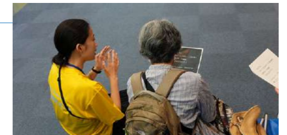
神奈川県民ホール オープンシアター 2023事前説明会

より多くの方々に鑑賞機会を提供できるよう、インクルーシブアプローチに取り組んでいます。鑑賞マナーや作品への理解を深めるための事前説明会、目のみえない、みえにくい方には点字パンフレットや音声解説、事前説明会、耳の聞こえない、聞こえにくい方にはセリフをタブレットやモニターに表示する字幕提供、聞こえを支援するヒアリングループの設置、手話通訳などの鑑賞サポートを公演やイベントで行っています。また、鑑賞マナーをゆるやかにして、よりリラックスした環境で鑑賞ができる上演スタイルも取り入れています。そして、NPO法人神奈川子ども未来ファンド、横浜市社会福祉協議会等を窓口、子育て・教育支援施設や里親子、母子家庭、高校生の奨学生から応募いただき、引率者やご家族あわせて177名を公演に招待しました。