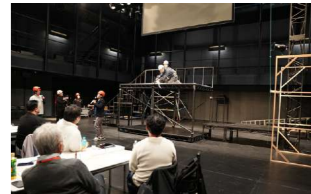
KAAT 舞台技術講座2024「高所作業における安全対策～落下を防ぐ～」