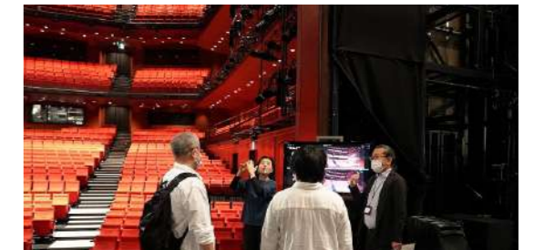
KAAT 神奈川芸術劇場 手話通訳付きバックステージツアー