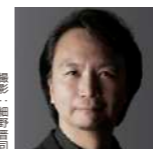
ながつかけいし 長塚圭史