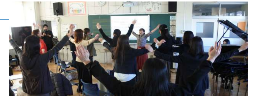
神奈川県立音楽堂 先生のためのアウトリーチ 音楽ワークショップ

学校に芸術家を派遣するプログラムを行っています。先生がプロの芸術家によるアウトリーチを体験し、授業にいかすヒントを得るための「先生のためのアウトリーチ」を、県央、湘南地区の小・中学校の先生を対象に計5回実施しました。