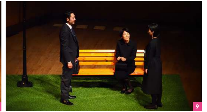
1 音楽堂室内オペラ・プロジェクト第6弾 鈴木優人指揮 バッハ・コレギウム・ジャパン ヘンデル『ジュリオ・チェーザレ』全3幕 / 2 子どものための音楽堂 せかいはともだち! / 3 音楽堂ヘリテージ・コンサート ファビオ・ピオンディ バッハ 無伴奏 全曲 撮影:松本和幸 / 4 音楽堂ヘリテージ・コンサート イアン・ポストリッジ シューベルト『白鳥の歌』 / 5 第56回クリスマス音楽会 ヘンデル『メサイア』全曲 / 6 シリーズ「新しい視点」紅葉坂プロジェクトVol.2 (crossing) / 7 シリーズ「新しい視点」紅葉坂プロジェクトVol.3 ワークインプログレス (小倉美春) / 8-9 シリーズ「新しい視点」庄司紗矢香 音楽とことば 未来への回帰 ※1~2、4~9撮影:ヒダキトモ