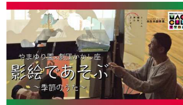
やまゆり園×劇団かかし座「影絵であそぶ～季節のうた～」

「ともに生きる ともに創る」を掲げた共生共創事業（神奈川県受託事業）では、4つのシニアプロジェクトをはじめ、やまゆり園や地域活動支援センターでのワークショップ、多文化への理解を深めるプロジェクトを実施しています。