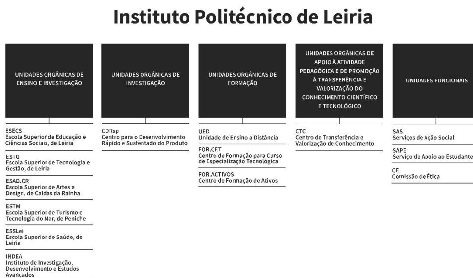
Figura 2. Organograma do Instituto Politécnico de Leiria

A estrutura orgânica do Instituto Politécnico de Leiria não foi alvo de alterações durante o ano de 2022, mantendo a configuração constante no organograma ilustrado abaixo.