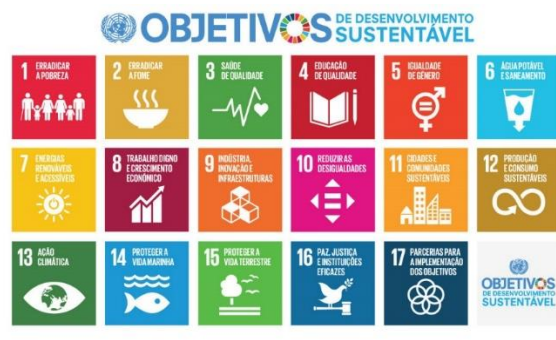
Figura 5. Agenda 2030: Objetivos de Desenvolvimento Sustentável

O Instituto Politécnico de Leiria afirma-se como um promotor da Agenda 2030 e dos 17 Objetivos de Desenvolvimento Sustentável no contexto regional, nacional e internacional. Com efeito, aquando da definição do Plano Estratégico 2030, o Instituto Politécnico de Leiria procurou assegurar o seu alinhamento com a Agenda 2030, bem como com as três principais agendas estratégicas da próxima década: a “Transformação Verde”, a “Transformação Digital” e a “Transformação pela Inovação Social”.