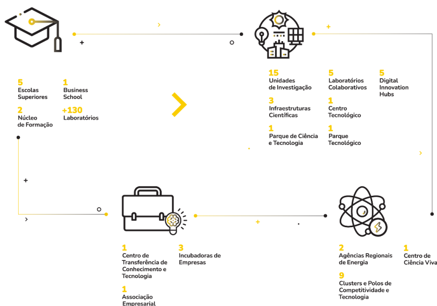
Figura 4. Ecossistema de I&amp;D+i do Instituto Politécnico de Leiria

No Instituto Politécnico de Leiria existem, atualmente, 15 Unidades de Investigação – seis como unidade de gestão principal, seis como de unidade de gestão participante e três delegações de associações de I&D sem fins lucrativos (cf. Quadro 17) – que desenvolvem a sua atividade em quatro domínios científicos (ciências sociais e humanas; engenharia e ciências exatas; ciências naturais e do ambiente; ciências da vida e da saúde) e constituem os elementos-chave para a I&D+i de elevada qualidade e valor acrescentado que se produz no Instituto Politécnico de Leiria.