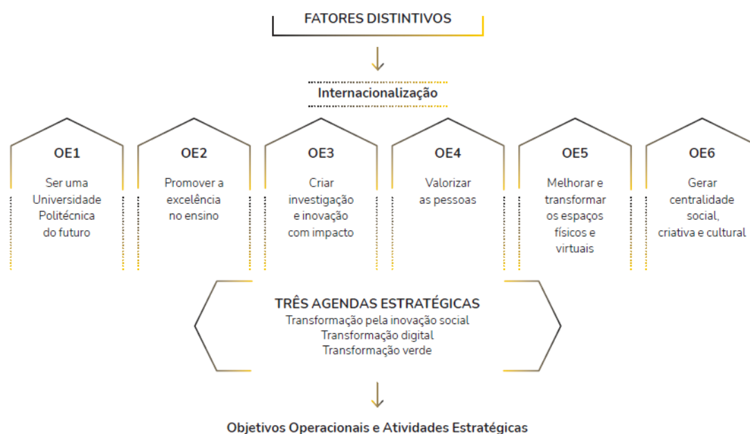
Figura 1. Objetivos estratégicos e desenvolvimento do Plano Estratégico 2030 do Instituto Politécnico de Leiria

Para cada OE foram definidos OO alinhados com as Agendas Estratégicas apresentadas, bem como um plano orientador de iniciativas estratégicas a desenvolver e um conjunto de indicadores de monitorização.