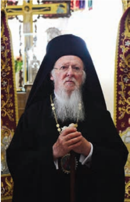
Ἡ Αὐτοῦ Θειοτάτη Παναγιότης ὁ Οἰκουμενικός Πατριάρχης κ.κ. ΒΑΡΘΟΛΟΜΑΙΟΣ

«Εἶναι ἡ ἀρχὴ τοῦ ἔτους δι' ἡμᾶς τοὺς χριστιανούς μία ἀφορμὴ καὶ μία θεία δωρεὰ διὰ νὰ ἐπαναπροσδιορίσωμεν τὴν σχέσιν μας μὲ τὸν χρόνον καὶ μὲ τὸν ἄνθρωπον καὶ νὰ ἀπελευθερωθῶμεν ἀπὸ τὰ δεσμὰ του· νὰ συνειδητοποιήσωμεν τι ἐπράξαμεν, τὰς δικαιοσύνας καὶ τὰς ἀδικίας μας ἐπὶ τῆς γῆς».