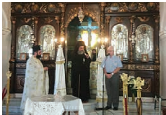
Εικ. 17, 18