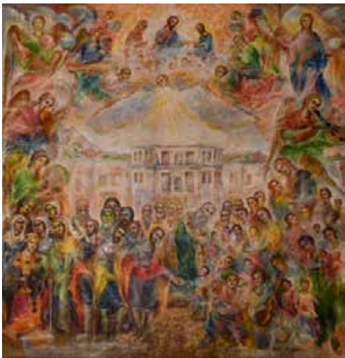
Πίνακας στά Γραφεία τῆς Ἱερᾶς Μητροπόλεως Ρεθύμνης καί Ἀύλοποτάμου. Ἔργο τοῦ ἀγιογράφου Γεωργίου Χρηστίδη.