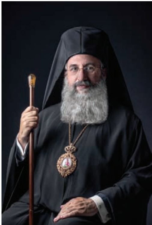
Ὁ Μητροπολίτης Ρεθύμνης καὶ Αὐλοποτάμου Εὐγένιος