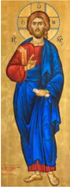
Εικόνα στό Γραφείο του Ἐπισκόπου στό Μητροπολιτικό Μέγαρο τῆς Ἱερᾶς Μητροπόλεως Ρεθύμνης καί Αὐλοποτάμου. Ἔργο του ἁγιογράφου Σπυρίδωνος Καλαϊτζαντωνάκη.

Ὁ Πνεύματι Ἁγίῳ συνημμένος, ἄναρχε Λόγε καί Υἱέ, ὁ πάντων ὁρατῶν καί ἀοράτων συμπαντουργός καί συνδημιουργός, τὸν στέφανον τοῦ ἐνιαυτοῦ εὐλόγησον, φυλάττων ἐν εἰρήνῃ τῶν Ὁρθοδόξων τὰ πλήθη, πρεσβείαις τῆς Θεοτόκου, καί πάντων τῶν Ἁγίων σου.