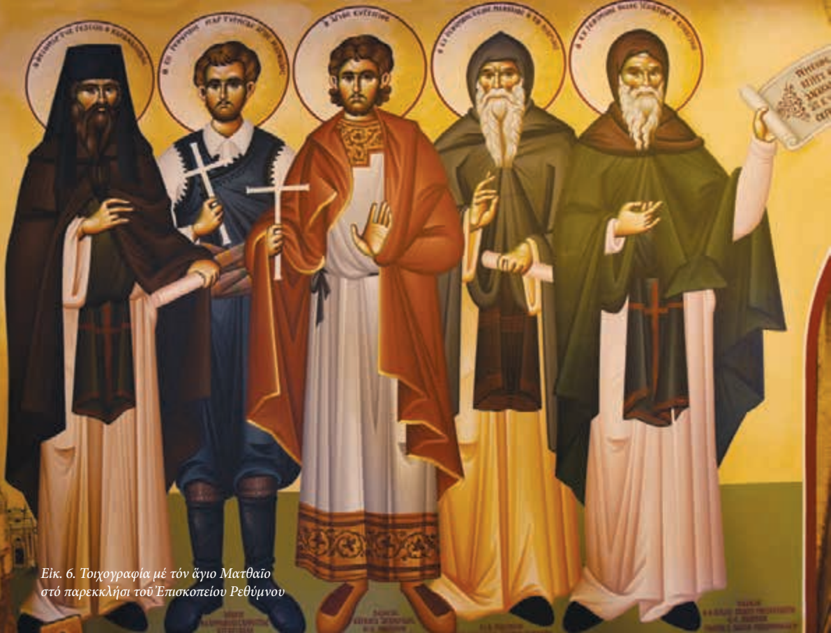
Εικ. 6. Τοιχογραφία με τόν ἅγιο Ματθαίο στό παρεκκλήσι του Ἐπισκοπείου Ρεθύμνου