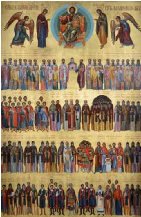
Η εικών πάντων τῶν ἐν Κρήτῃ διαλαμψάντων Ἁγίων