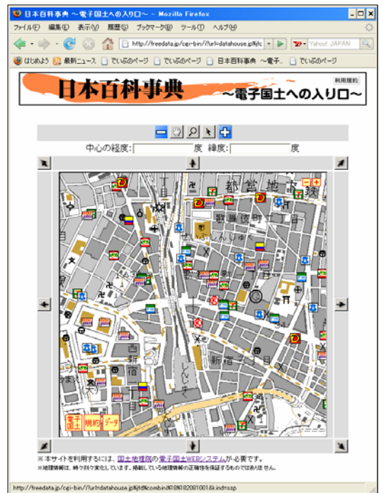
図-3 非 ActiveX 型による重ね合わせ表示例 日本百科事典 http://freedata.jp/ より

電子国土 Web システムを用いると、例えば、コン ビニエンスストアのデータはサイト A から、国道記 号はサイト B から、背景地図は国土地理院から呼び 出してきて一つの画面に表示するといったことを実 現させることができる。これによって、従来は、重 ね合わせるデータを事前に 1 箇所に集めるという過 程が必要だったものを、それぞれのデータが管理主 の元に置かれたままで重ね合わせが実現できるとい う点で、管理コストの低減に役立つことが期待され る。非 ActiveX 型のテスト運用開始により、プラグ イン版では利用できなかったブラウザでも電子国土 にアクセスできるようになった。ぜひとも一度、電 子国土をご覧になっていただきたい。