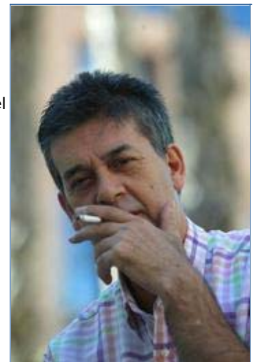
+ Guillem Terribas presentarà el llibre a Girona el dia 14 de novembre.