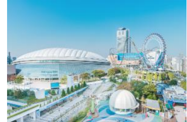
【例】会員限定 特典付き東京ドーム見学ツアー

三井不動産グループの各種施設・サービスを活用し、すまいに関連したサービスはもちろのこと、くらしの豊かさ向上に貢献する幅広く多彩なサービスを提供します。