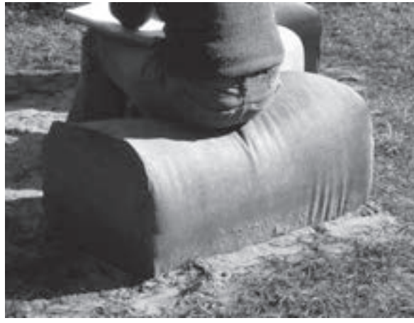
Jardín en Garupá, Argentina, 2003. Garden in Garupá, Argentina, 2003