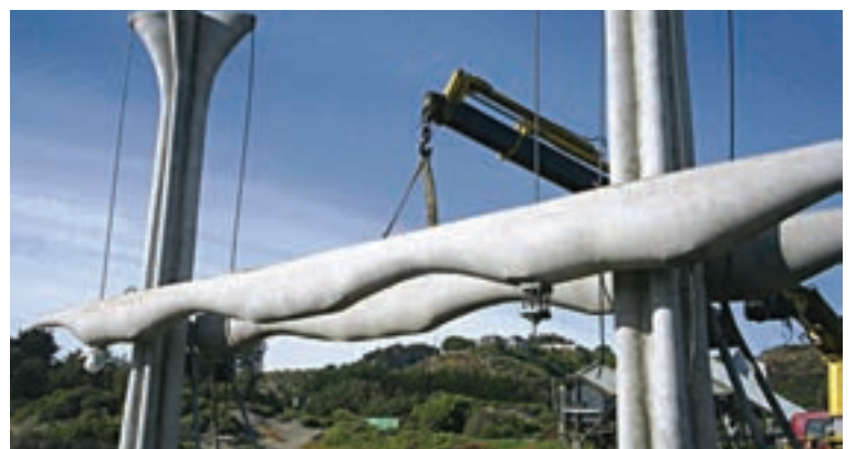
Montaje de la columna compuesta en la duna antes del hormigonado del centro Mounting of a composed column in the dune before the pouring of the center