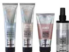
KONTROLA LOKÓW | ANTY PUSZENIE