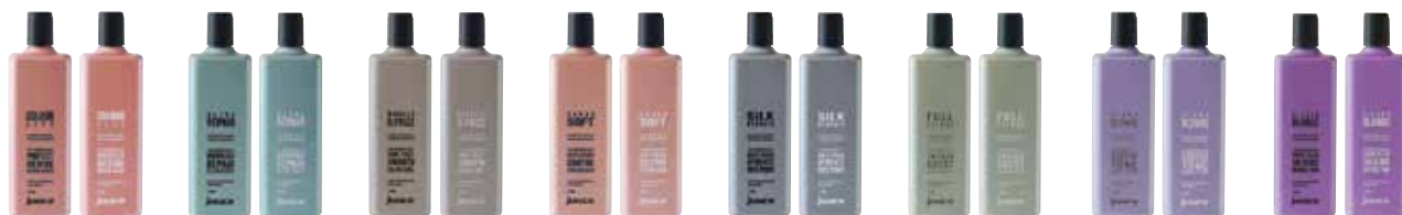
SZAMPONY / ODŻYWKI