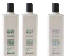
SPECJALISTYCZNE SZAMPONY / ODŻYWKI