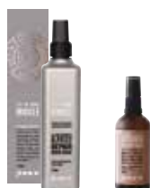
REGENERACJA | OCHRONA NAWILŻENIE ODŻYWKI BEZ SPŁUKIWANIA