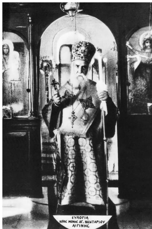
Ὁ Ἅγιος Νεκτάριος στὴν Ωραία Πύλη. Ὅπισθεν διακρίνονται τὰ ἐξαπτέρυγα. «Χαμηλοῦ επιπέδου»...