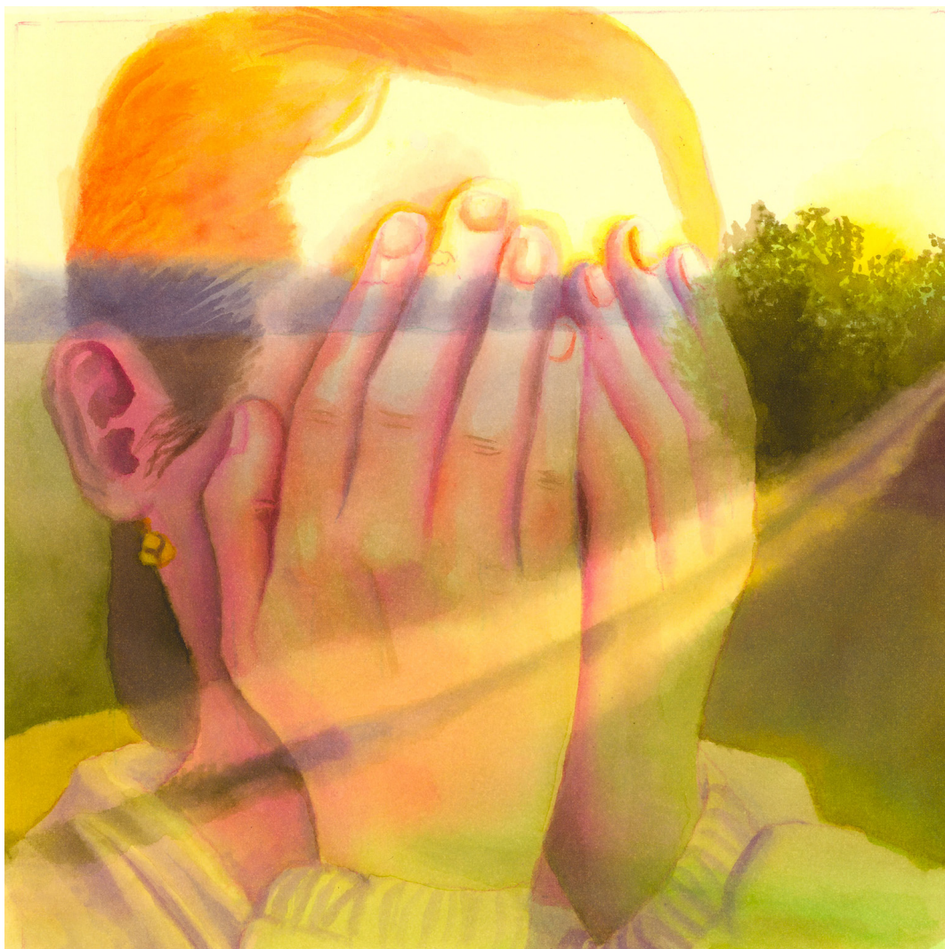
Maité Grandjouan - Tout doit disparaître , Aquarelle sur papier, 20 x 20 cm

La galerie Huberty & Breyne, Paris I Chapon est heureuse de proposer, dans le cadre de la programmation Mycélium, cette exposition de plus d'une centaine de dessins inédits du 23 novembre 2024 au 4 janvier 2025.