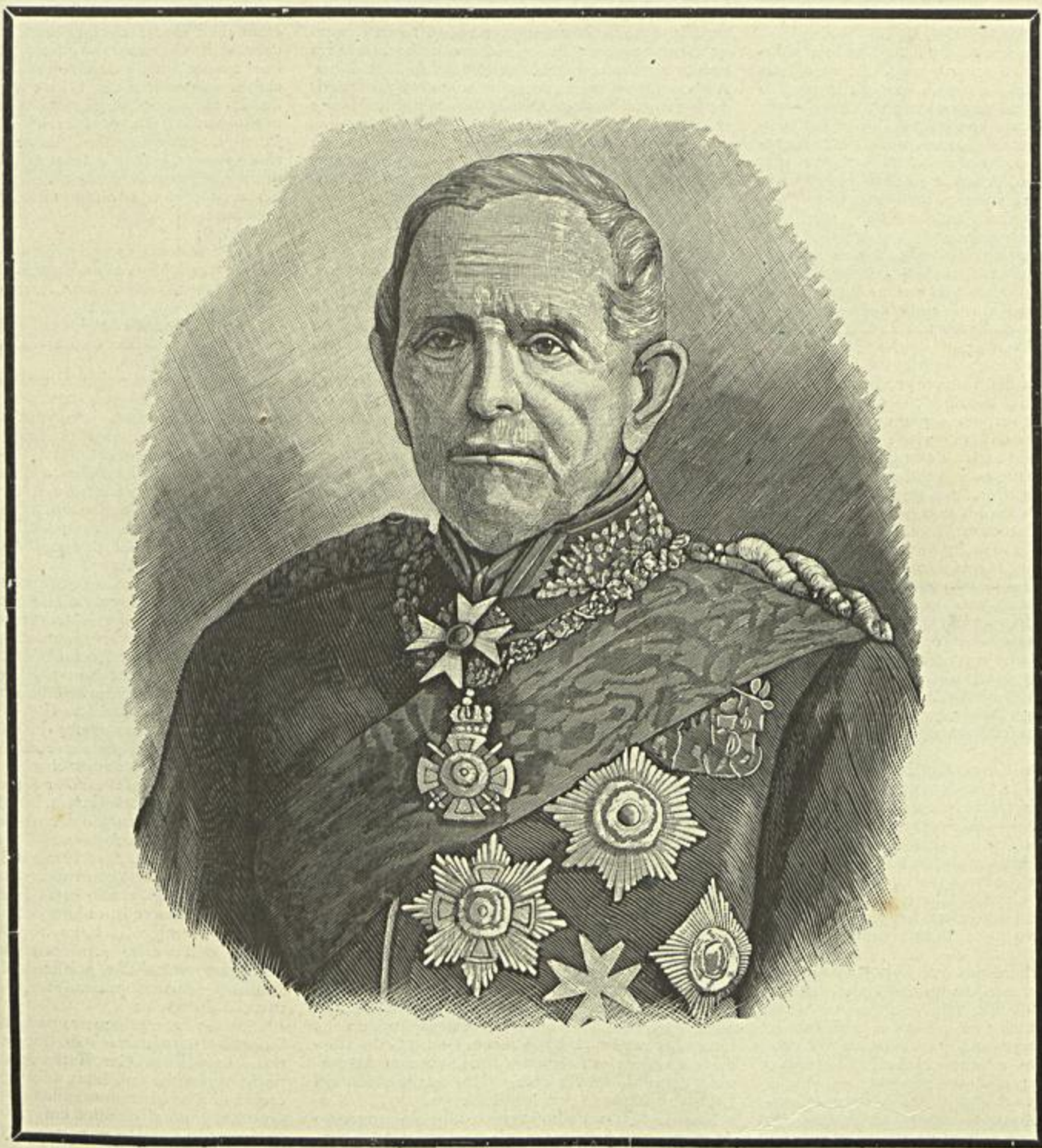
O GENERAL CONDE DE MOLTKE — FALLECIDO EM 24 DE ABRIL DE 1891