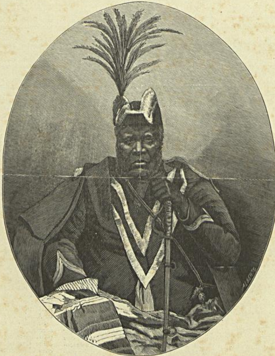
O REI D. PEDRO V DO CONGO — FALLECIDO EM S. SALVADOR DO CONGO

Decretos de economias e novo addiamento das côrtes é o que temos n'esta ultima dezena, o que