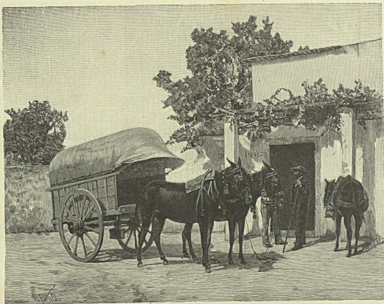
A' PORTA DA VENDA, (ESTRADA DE TORRES) — Quadro de Silva Porto