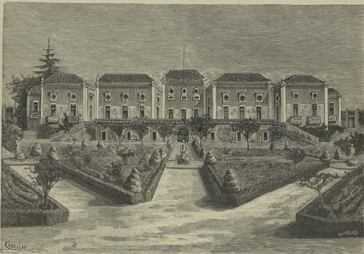
O PALACIO REAL DE BELEM, VISTO DO JARDIM (Desenho do natural por Cazellas)

rão constituir o nosso verdadeiro imperio africano, por meio do progresso e da civilização que irá desentranhar as riquezas naturaes d'aquellas regiões.