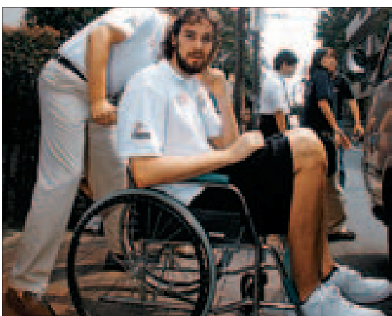
Pau Gasol, ayer, a su llegada a la clínica de Saitama.