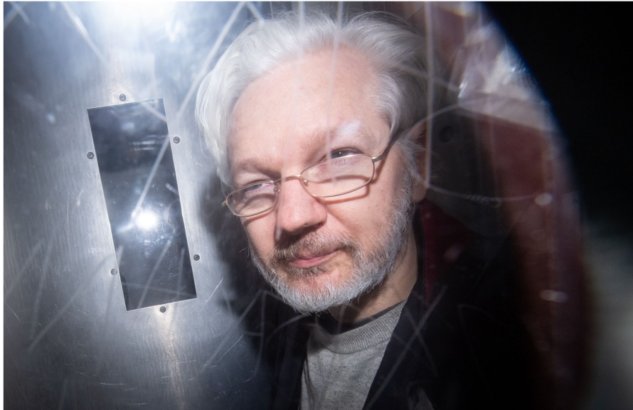
50 Wochen Haft wegen Verstosses gegen Kautionsauflagen: Julian Assange im Januar 2020 in einem Polizeiwagen auf dem Weg ins Londoner Hochsicherheitsgefängnis Belmarsh.