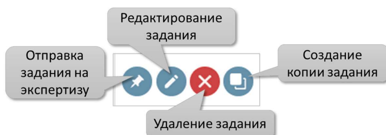
Рисунок 10 – Панель инструментов задания на вкладке «Мои задания»

Примечание. Для перехода к просмотру (выполнению) задания нужно нажать на ссылку с названием задания. Задание будет открыто в новом окне.