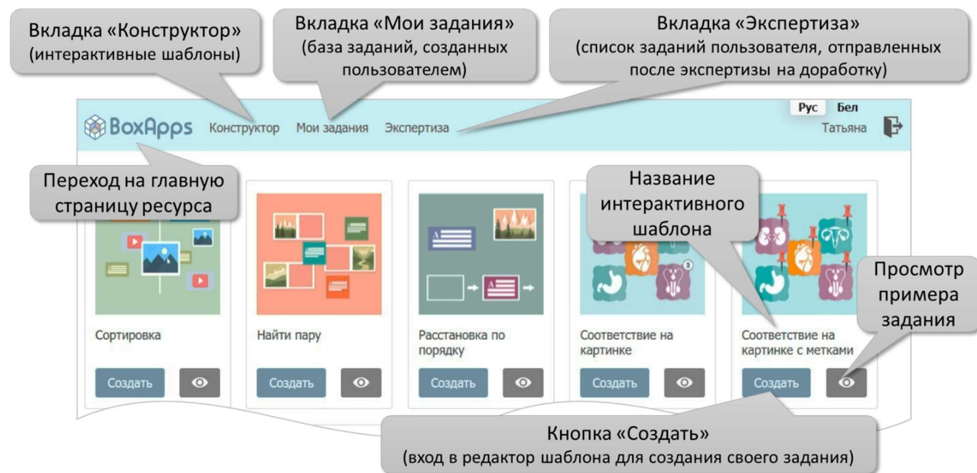
Рисунок 8 – Окно конструктора интерактивных заданий

На открывшейся странице (активна вкладка «Конструктор») отображаются ссылки на шаблоны для создания интерактивных заданий (Рисунок 8).